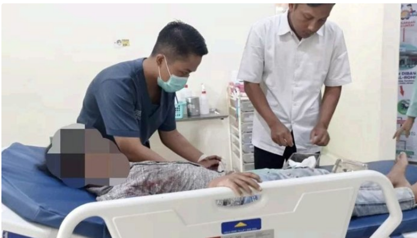
Korban mendapat perawatan dari tenaga medis

BANYUWANGI - Bocah berusia 10 tahun dikabarkan mengalami luka parah usai terkena ledakan petasan. Peristiwa itu terjadi di Dusun Pasembon, Desa Sambirejo, Kecamatan Bangorejo, Kabupaten Banyuwangi, Jawa Timur, Jum'at (29/3/2024) siang.